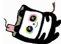
北九州市立子ども図書館 マスコットキャラクター 「ヨンダ・コト・アール」